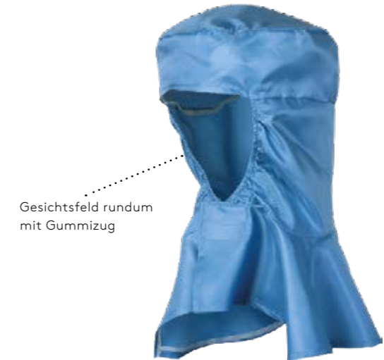
Gesichtsfeld rundum mit Gummizug

Material: HABETEX® REINRAUM-VISKOSE / Grammatik ca. 135 g/m 2 Artikelnummer: 06013 77005 000 53 Fertigteilgewicht: ca. 70 g Farbe: grau Größe: Einheitsgröße Tragekomfort: ★ ★ Industrierwäsche: ★ ★