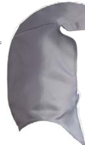
Für größere Helme geeignet