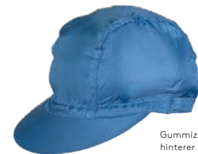
Gummizug an hinterer Mitte

Material: HABETEX® CLIMATIC® PRO / Grammatik ca. 105 g/m 2 Art.-Nr.: 06015 77002 000 + FARB-NR. Fertigteilgewicht: ca. 30 g Farbe: hellblau 47 Farbe: grau 53 Größe: 1-3 Tragekomfort: ★ ★ Industrierwäsche: ★ ★